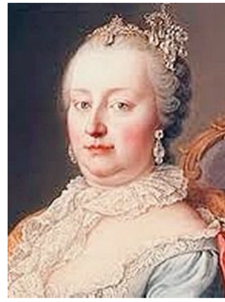
Maria Teresa d'Austria