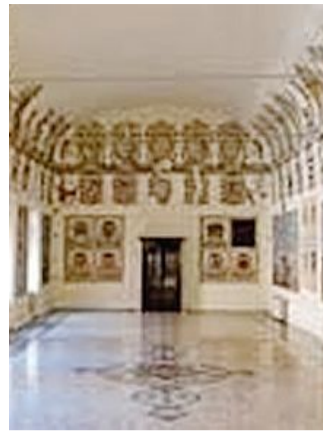
La sala degli Stemmi