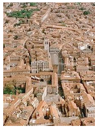
Una vista del centro di Ferrara

La conversazione odierna consentirà di analizzare importanti aree della città, alla luce delle scoperte degli ultimi vent'anni nel campo della ricerca storica, in rapporto con le indagini archeologiche. Saranno presi in esame alcuni luoghi del centro, tra cui piazza Trento e Trieste, corso Martiri della Libertà, piazza Municipale, il Giardino delle Duchesse e piazza Corvecchia, vedendone le principali trasformazioni nei secoli.